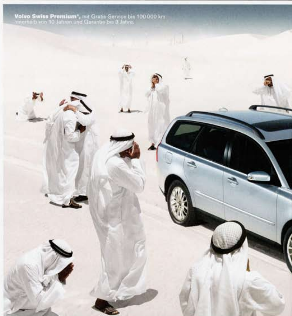
Volvo Swiss Premium*, mit Grate-Service bis 100 000 km innerhalb von 10 Jahren und Garantie bis 3 Jahre.

Tote und Halbverstümmelte sorgen würden. Ein Unterschied zu Ruanda war, dass er in Liberia die schriftliche Einwilligung für Amputationen bei Patienten oder ihren Verwandten einholen musste – aus Angst vor amerikanischen Anwälten, die in Monrovia herumlungerten und das IKRK mit Sammelklagen einzudecken hofften. In Kigali waren nicht einmal mehr Sammelkläger anzutreffen. Gleich wie in Ruanda war hingegen die Schutzlosigkeit des Spitals. Steiger hatte stets Geld und Pass in seinen Schuhen, um notfalls vor Taylors Kindersoldaten flüchten zu können. Für Steiger eine Erfahrung mehr, dass der Status quo keine Alternative war, niemals.